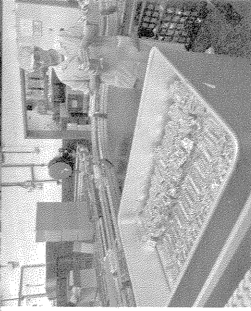
Rombouts blijft marktleider in het segment van de koffiefilters.