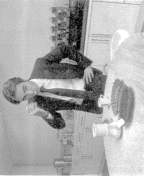
De gebrande koffie wordt regelmatig geproefd in het smaaklabo.